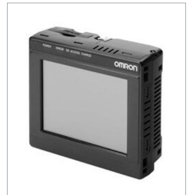
タッチファインダ FQ2-D30