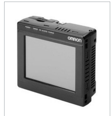
タッチファインダ FQ2-D30