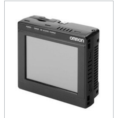
Touch Finder FQ2-D30