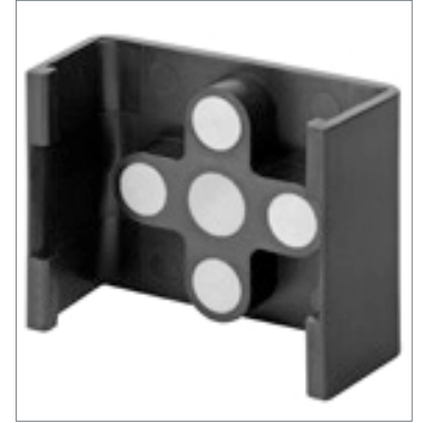
Mounting Bracket FQ-XL