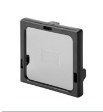
Polarizing Filter Attachment FQ-XF1