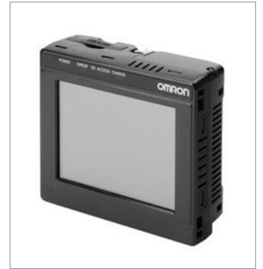
Touch Finder FQ2-D30