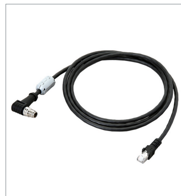
イーサネットケーブル（超耐屈曲） FHV-VNLBX2 10M