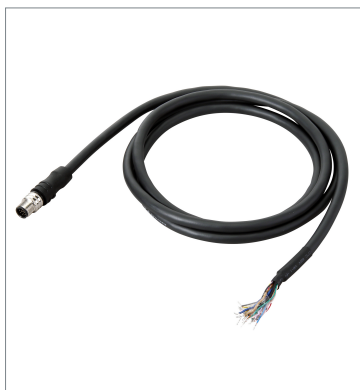
I/Oケーブル（耐屈曲） FHV-VDB2 20M