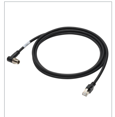
Ethernet Cable (Bend Resistant)