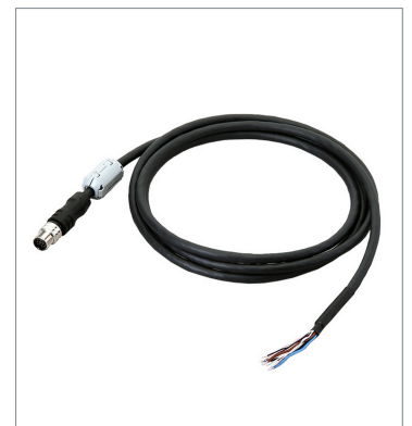
I/Oケーブル（超耐屈曲）