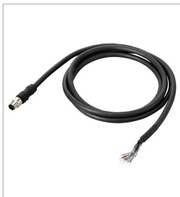
I/Oケーブル (耐屈曲) FHV-VDB2 2M