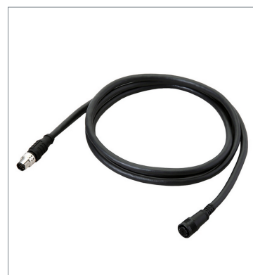
スマートカメラデータユニットケーブル（耐屈曲） FHV-VUB2 10M