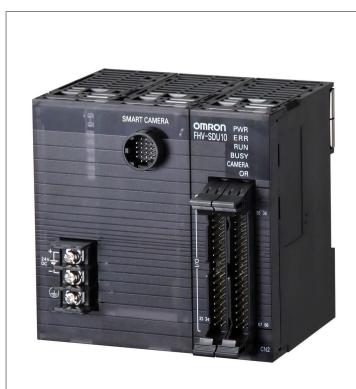
Smart Camera Data Unit FHV-SDU10