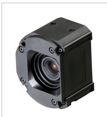
Standard Lens Module (Autofocus) FHV-LEM-S25