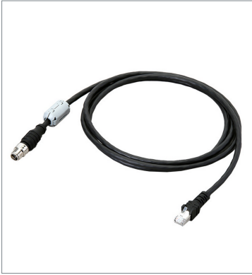
Ethernet Cable (Super Bend Resistant)