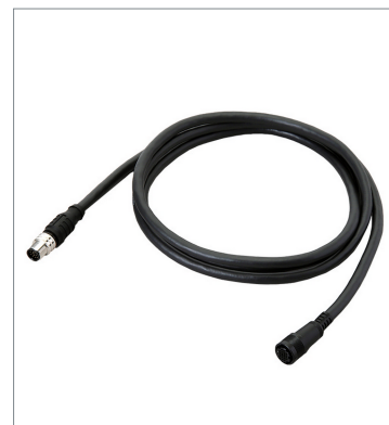
スマートカメラデータユニットケーブル（耐屈曲）