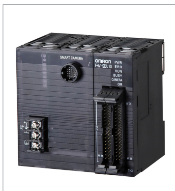
スマートカメラデータユニット