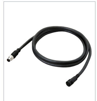
スマートカメラデータユニットケーブル (耐屈曲) FHV-VUB2 10M