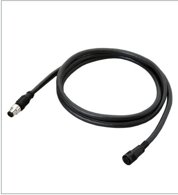
Smart Camera Data Unit Cable (Bend Resistant)