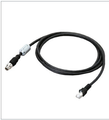
イーサネットケーブル (超耐屈曲) FHV-VNBX2 10M