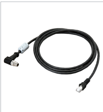
Ethernet Cable (Super Bend Resistant)