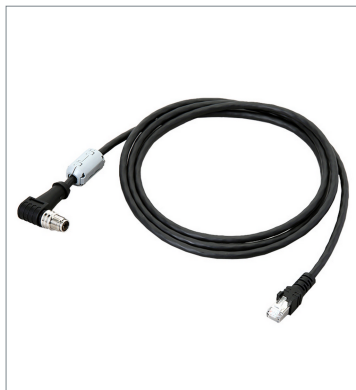
Ethernet Cable (Super Bend Resistant)