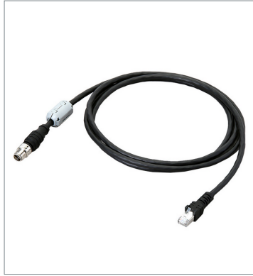
Ethernet Cable (Super Bend Resistant)