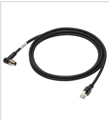
Ethernet Cable (Bend Resistant) FHV-VNLB2 2M