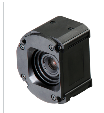
Standard Lens Module (Autofocus) FHV-LEM-S12