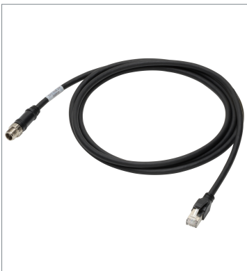
Ethernet Cable (Bend Resistant)