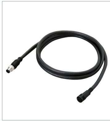
Smart Camera Data Unit Cable (Bend Resistant)