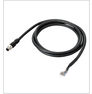
I/O Cable (Bend Resistant)