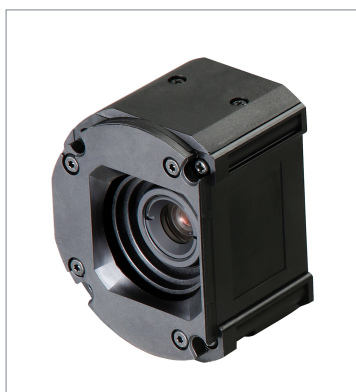
Standard Lens Module (Autofocus) FHV-LEM-S25