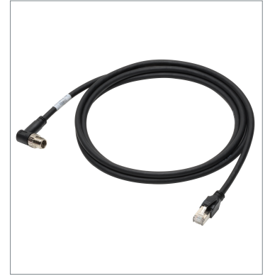
Ethernet Cable (Bend Resistant) FHV-VNLB2 10M