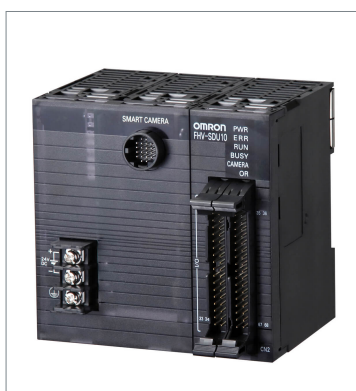
Smart Camera Data Unit FHV-SDU10