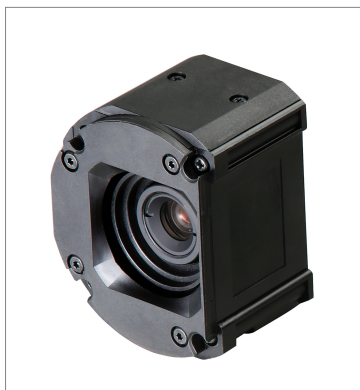
Standard Lens Module (Autofocus) FHV-LEM-S06