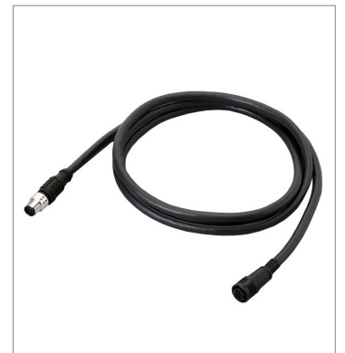
Smart Camera Data Unit Cable (Bend Resistant) FHV-VUB2 10M