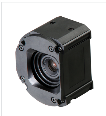
Standard Lens Module (Autofocus) FHV-LEM-S09