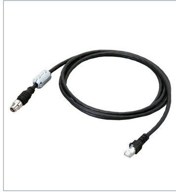
Ethernet Cable (Super Bend Resistant) FHV-VNBX2 5M