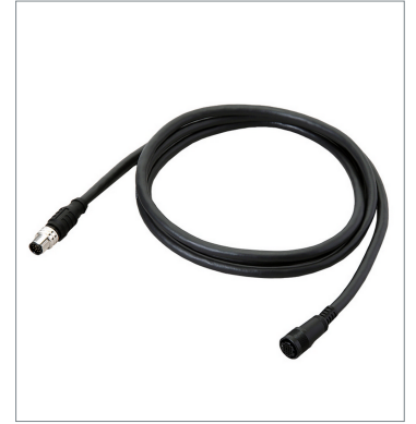
Smart Camera Data Unit Cable (Bend Resistant)