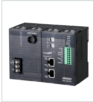
Smart Camera Data Unit FHV-SDU30