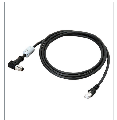
Ethernet Cable (Super Bend Resistant)