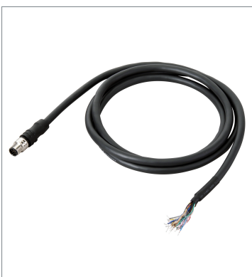
I/O Cable (Bend Resistant) FHV-VDB2 5M