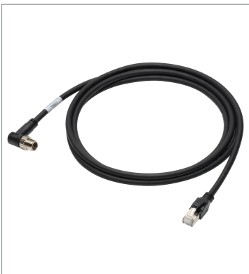
Ethernet Cable (Bend Resistant)