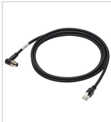
Ethernet Cable (Bend Resistant)