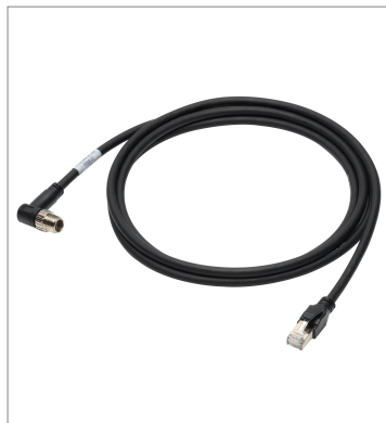
Ethernet Cable (Bend Resistant)