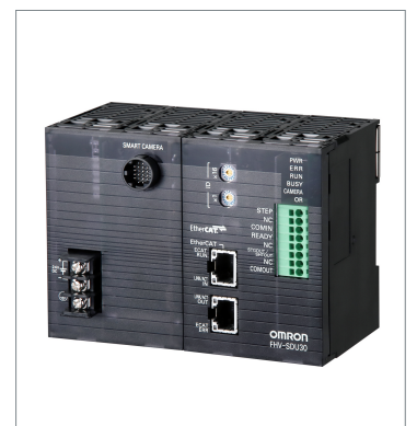
Smart Camera Data Unit FHV-SDU30