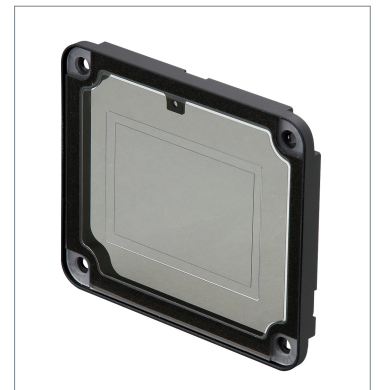
Polarized Light Filter