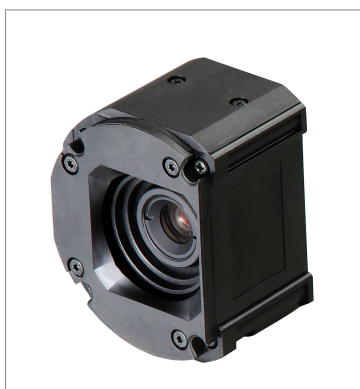
Standard Lens Module (Autofocus) FHV-LEM-S16