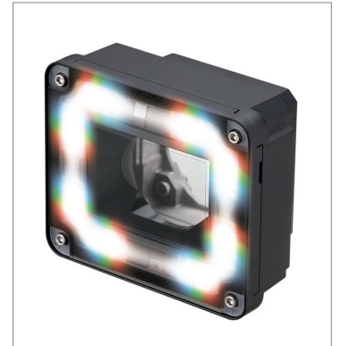
Lighting Module FHV-LTM-MC