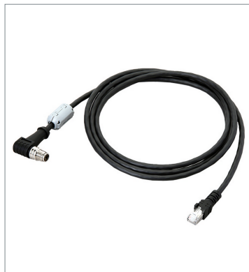
Ethernet Cable (Super Bend Resistant) FHV-VNLBX2 5M