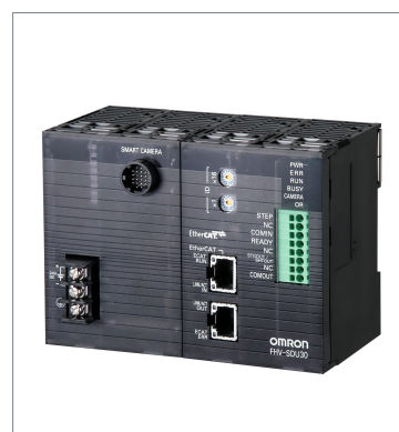
Smart Camera Data Unit FHV-SDU30