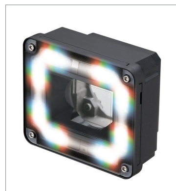
Lighting Module FHV-LTM-MC