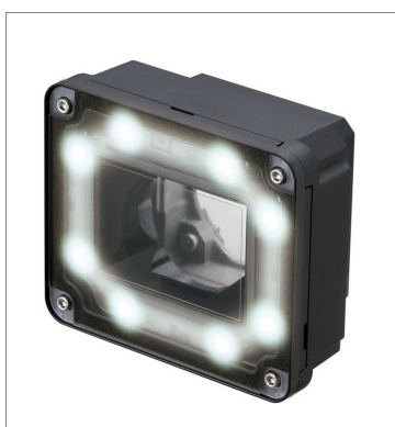
Lighting Module FHV-LTM-W