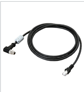
Ethernet Cable (Super Bend Resistant) FHV-VNLBX2 10M