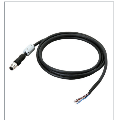
I/O Cable (Super Bend Resistant)