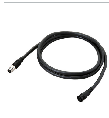
スマートカメラデータユニットケーブル（耐屈曲） FHV-VUB2 2M