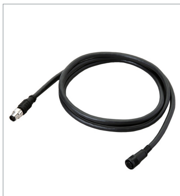
スマートカメラデータユニットケーブル（耐屈曲） FHV-VUB2 10M