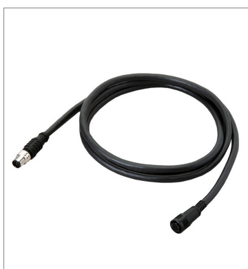
スマートカメラデータユニットケーブル（耐屈曲） FHV-VUB2 3M