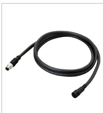
スマートカメラデータユニットケーブル（耐屈曲） FHV-VUB2 5M