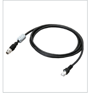
Ethernet Cable (Super Bend Resistant)