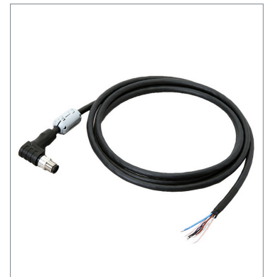
I/O Cable (Super Bend Resistant)