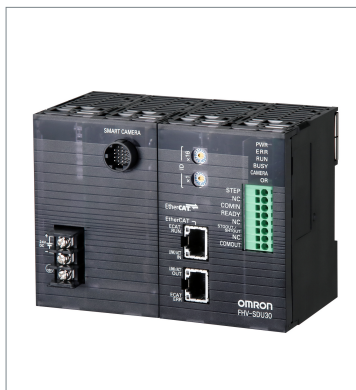
Smart Camera Data Unit FHV-SDU30