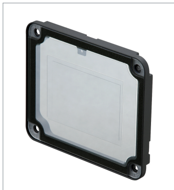
Polarized Light Filter