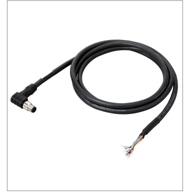
I/O Cable (Bend Resistant)