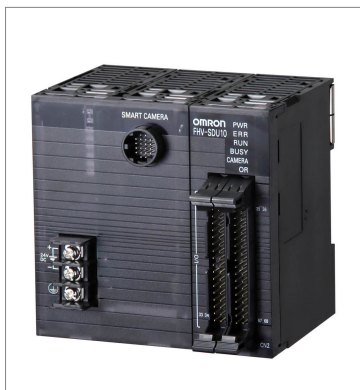
Smart Camera Data Unit FHV-SDU10