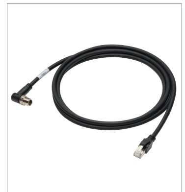
イーサネットケーブル (耐屈曲) FHV-VNLB2 5M