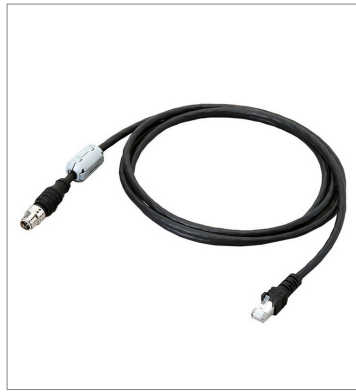
イーサネットケーブル (超耐屈曲) FHV-VNBX2 5M