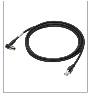
イーサネットケーブル (耐屈曲) FHV-VNLB2 10M