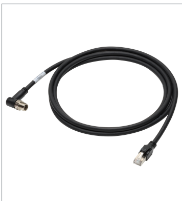
イーサネットケーブル (耐屈曲) FHV-VNLB2 2M