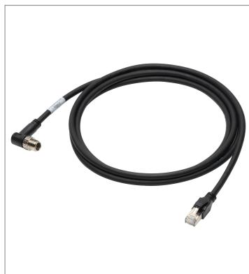
イーサネットケーブル (耐屈曲) FHV-VNLB2 3M