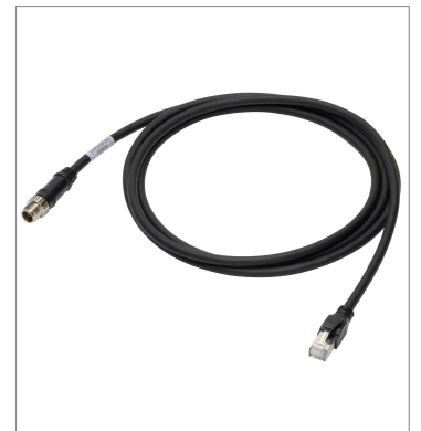
Ethernet Cable (Bend Resistant)