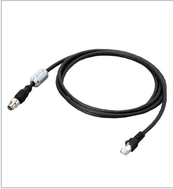
Ethernet Cable (Super Bend Resistant) FHV-VNBX2 10M