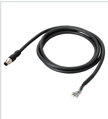
I/O Cable (Bend Resistant)