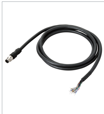
I/O Cable (Bend Resistant)