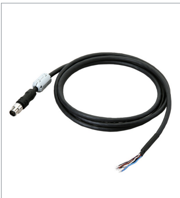
I/O Cable (Super Bend Resistant)