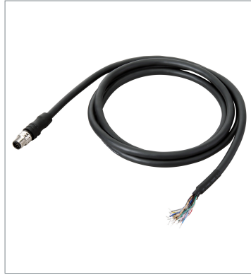
I/O Cable (Bend Resistant)