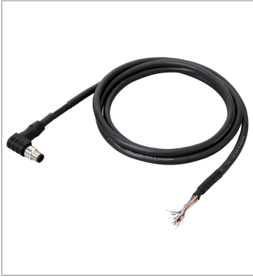
I/O Cable (Bend Resistant)