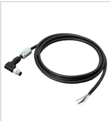
I/O Cable (Super Bend Resistant)