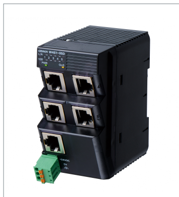
Industrial Switching Hub W4S1-05D