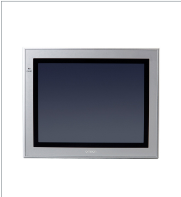
Touch Panel Monitor FH-MT12