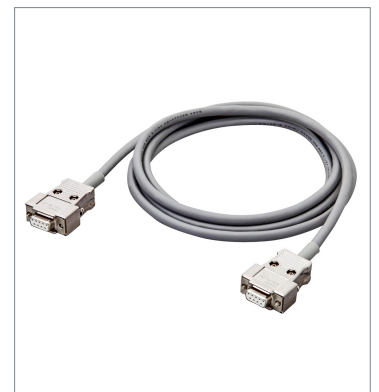
RS-232C Cable XW2Z-500PP-1