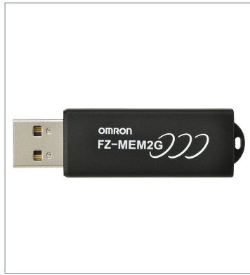
USB Memory FZ-MEM2G