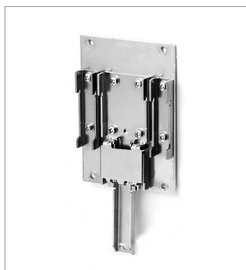
DIN Rail Mounting Bracket FH-XDM-L