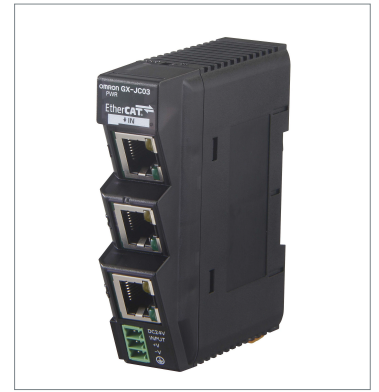
EtherCAT Junction Slave GX-JC03