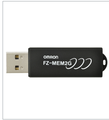
USB Memory FZ-MEM2G