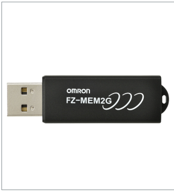
USB Memory FZ-MEM16G