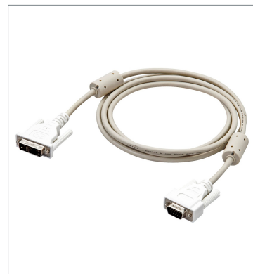
DVI-アナログ変換ケーブル FH-VMDA 2M