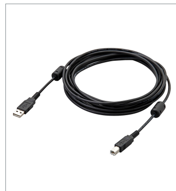
USBケーブル FH-VUAB 2M