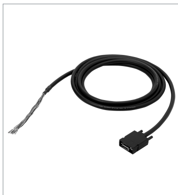
エンコーダケーブル FH-VR 1.5M