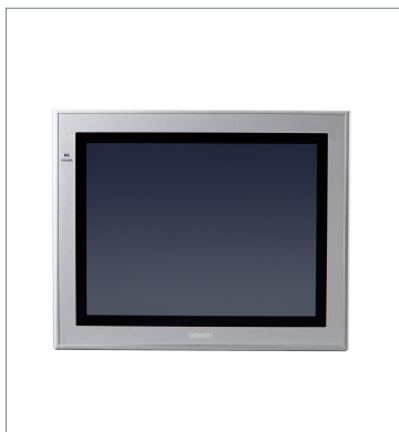
タッチパネルモニタ FH-MT12