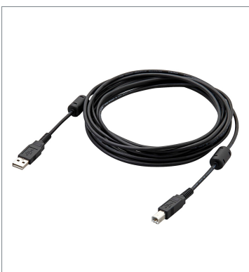
USBケーブル FH-VUAB 5M