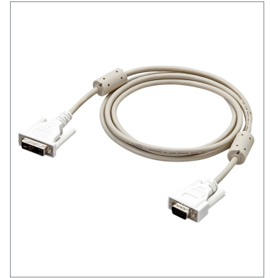
DVI-アナログ変換ケーブル FH-VMDA 2M