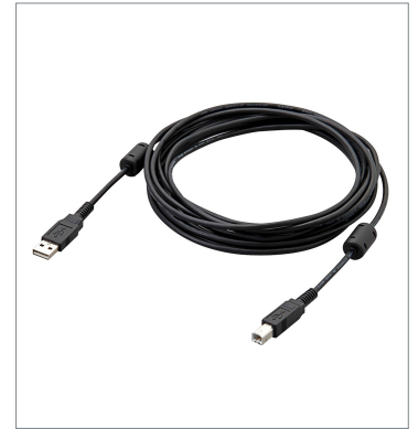
USBケーブル FH-VUAB 2M