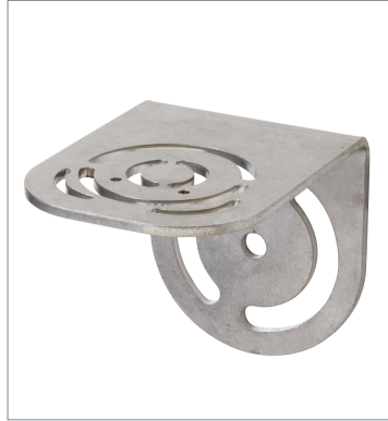
L字型取り付け金具 V430-AM0