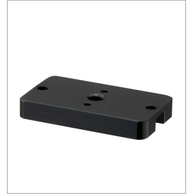
カメラマウントブラケット V430-AM1