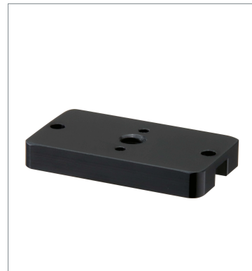
Mounting Block V430-AM1