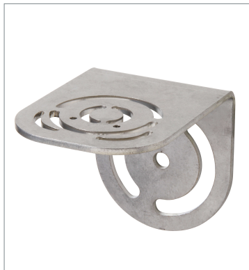
L Bracket V430-AM0