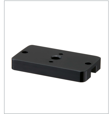
Mounting Block V430-AM1