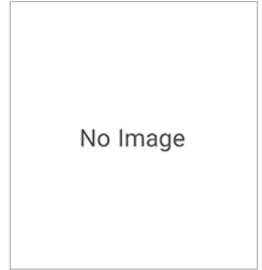
Protective Bracket F39-L12