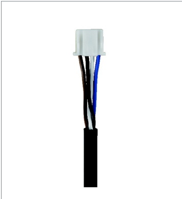
Connector with Cable EE-1017 1M