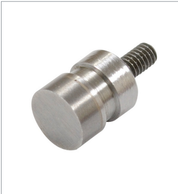
Probe for Flat Surfaces E9NC-TB3