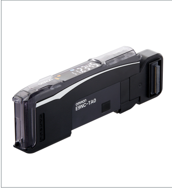
Contact-Type Smart Sensor E9NC-TA0