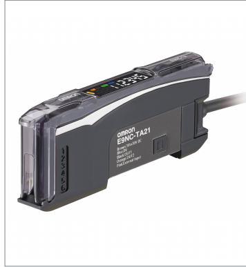
Contact-Type Smart Sensor E9NC-TA21 2M