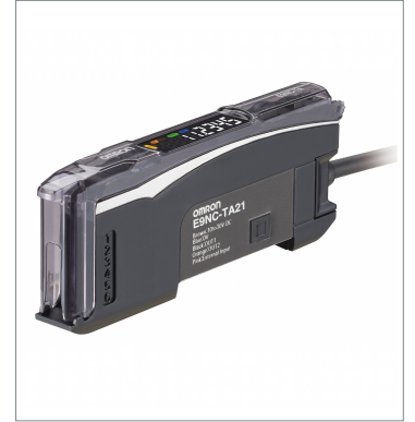
Contact-Type Smart Sensor E9NC-TA51 2M