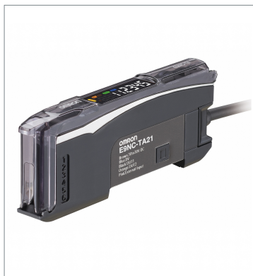
スマート接触センサ アンプユニット E9NC-TA21 2M