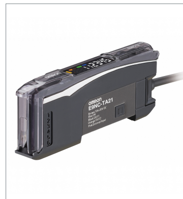
スマート接触センサ アンプユニット E9NC-TA51 2M