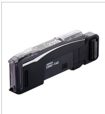
スマート接触センサ E9NC-TA0