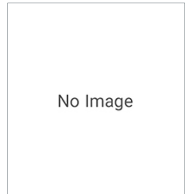
Connection Cable between Preamplifier and Amplifier Unit E9NC-TXC5