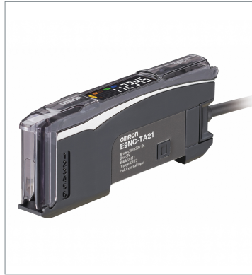
Contact-Type Smart Sensor E9NC-TA21 2M