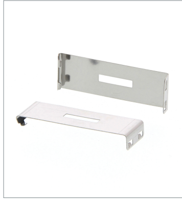
Plug-in type Slit