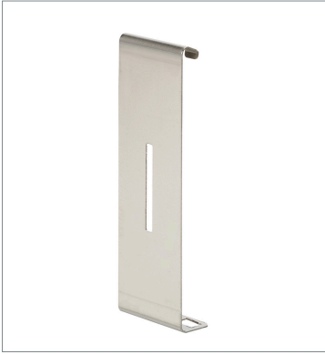
Plug-in type Slit