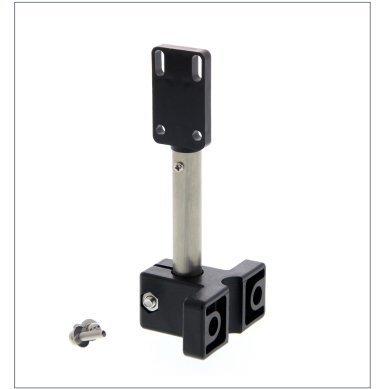
Sensor Adjuster E39-L150