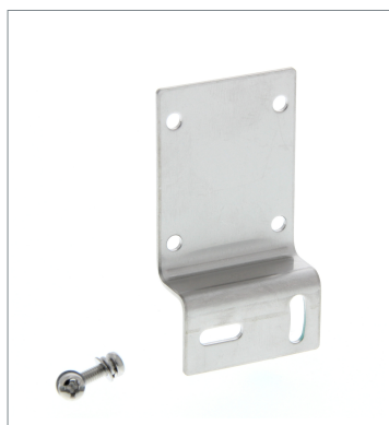
Horizontal Mounting Bracket E39-L43