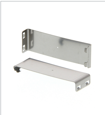
はめ込みタイプスリット