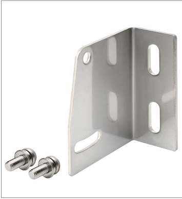
背面取り付け用金具