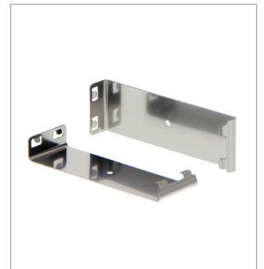
Plug-in type Slit