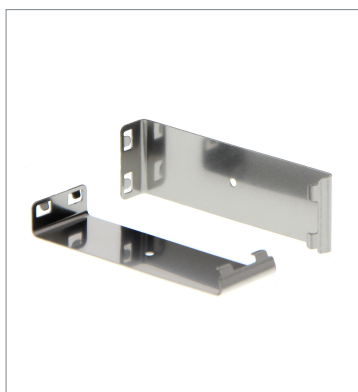
Plug-in type Slit E39-S65B