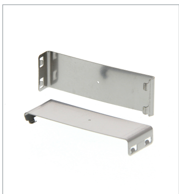
Plug-in type Slit E39-S65A