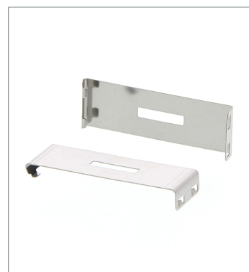
Plug-in type Slit E39-S65F