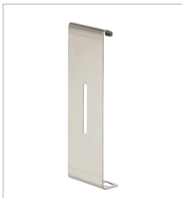
Plug-in type Slit E39-S65E