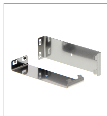
Plug-in type Slit E39-S65C