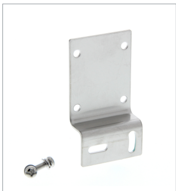
Horizontal Mounting Bracket E39-L43