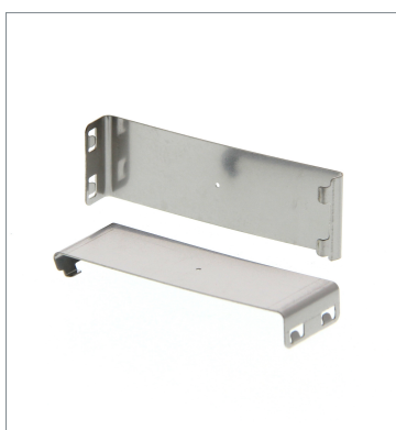
Plug-in type Slit E39-S65A