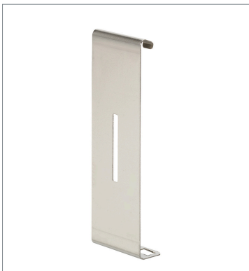
はめ込みタイプスリット