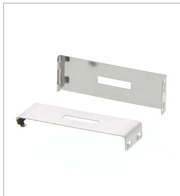
はめ込みタイプスリット