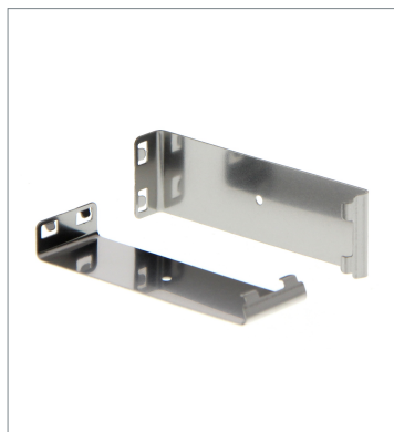
はめ込みタイプスリット