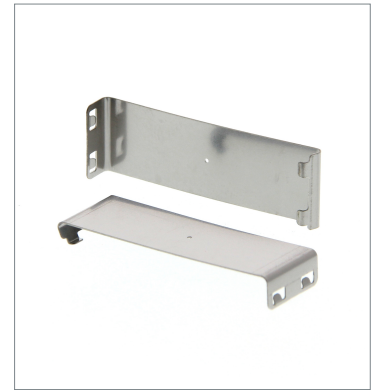
はめ込みタイプスリット