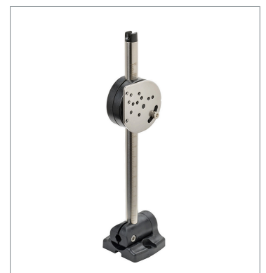
Sensor Adjuster E39-L93FH