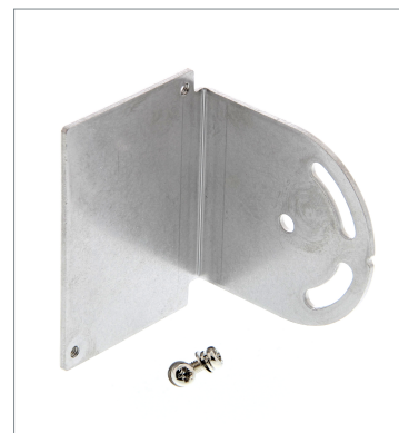
Mounting Bracket E39-L96