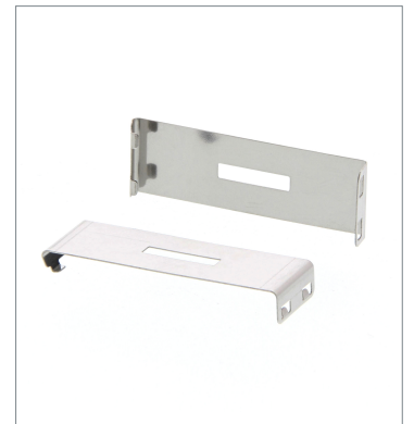
はめ込みタイプスリット