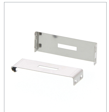
Plug-in type Slit