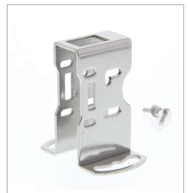
Metal Protective Cover Bracket E39-L98