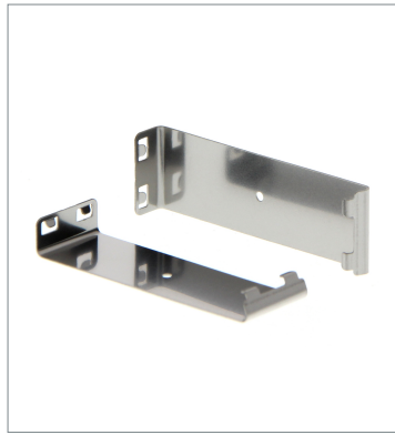
Plug-in type Slit