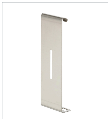
Plug-in type Slit