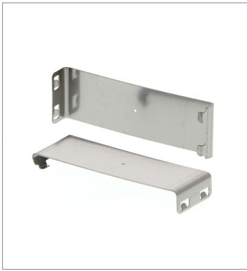
Plug-in type Slit