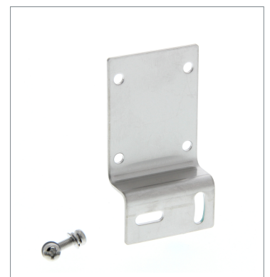
Horizontal Mounting Bracket E39-L43