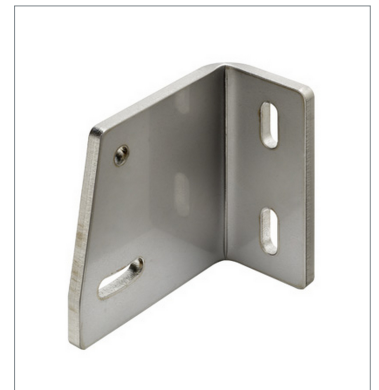
Photoelectric sensor accessories E39-L203