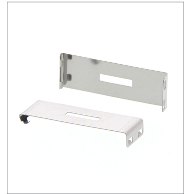
Plug-in type Slit