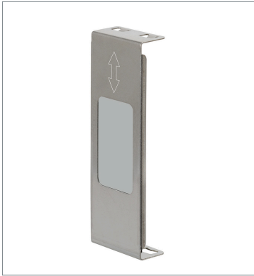
Mutual Interference Protection Filter E39-E11