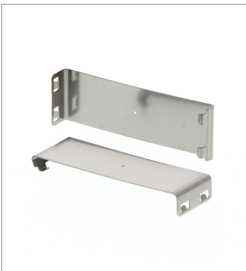
Plug-in type Slit