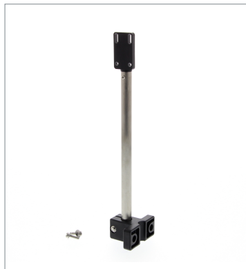
Sensor Adjuster E39-L151