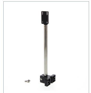
Sensor Adjuster E39-L151