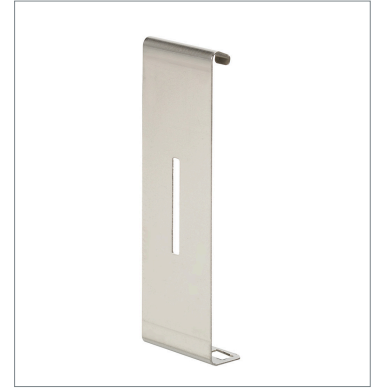
はめ込みタイプスリット