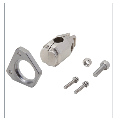
Photoelectric sensor accessories E39-L261