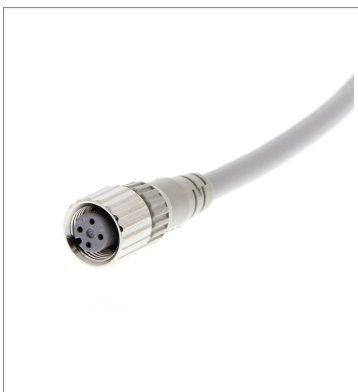
Round Water-resistant Connector (M12 Threads)