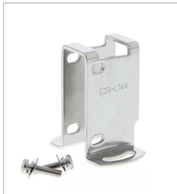
Compact Protective Cover Bracket E39-L144