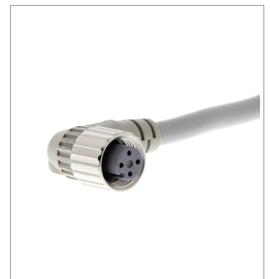
Round Water-resistant Connector (M12 Threads)