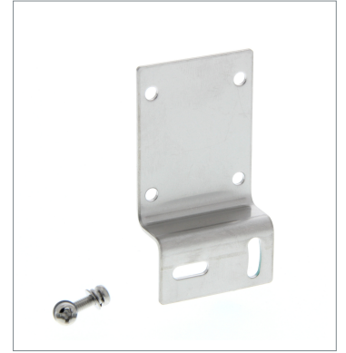
Horizontal Mounting Bracket