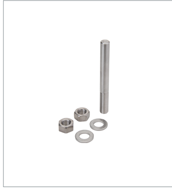
Photoelectric sensor accessories