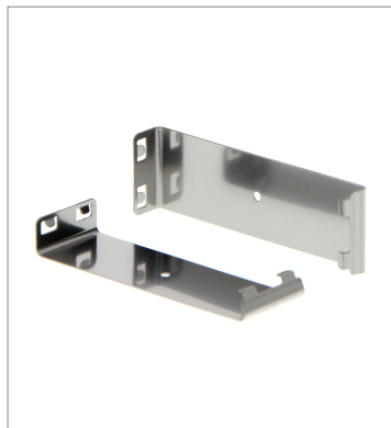
Plug-in type Slit