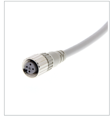
Round Water-resistant Connector (M12 Threads)