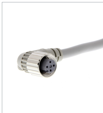
Round Water-resistant Connector (M12 Threads)