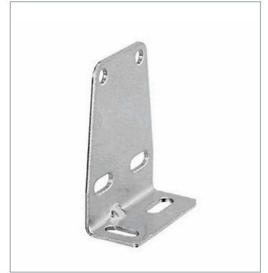
Mounting Bracket for Sensor E39-L104