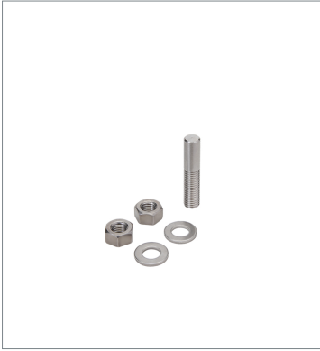
Photoelectric sensor accessories