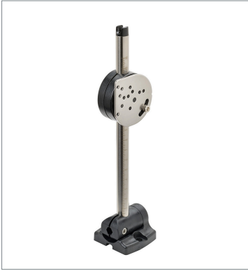
センサアジャスタ