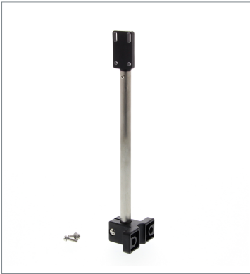
センサアジャスタ E39-L151