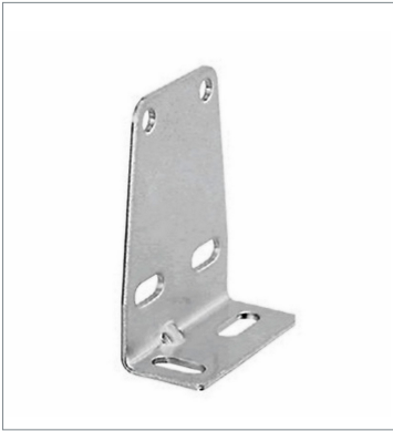
センサ取り付け金具 E39-L104