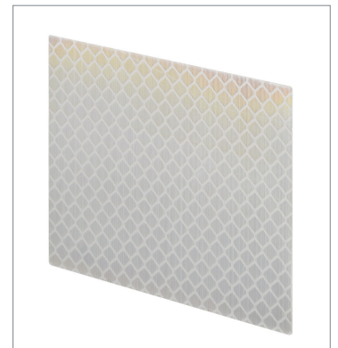
Tape Reflector E39-RS3