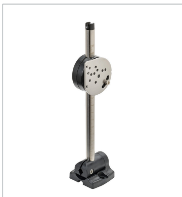
Sensor Adjuster E39-L93FH