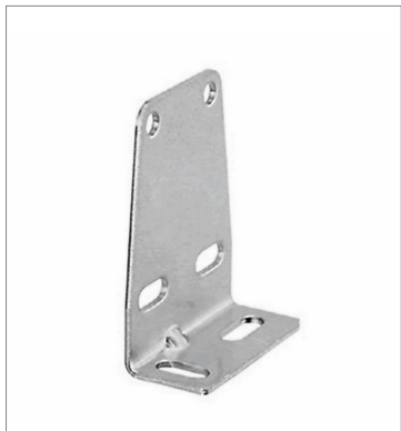
Mounting Bracket for Sensor E39-L104