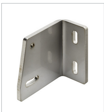
Photoelectric sensor accessories E39-L203