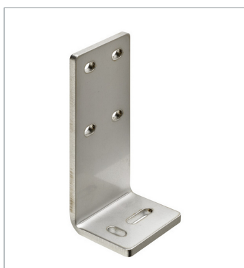
Photoelectric sensor accessories E39-L211