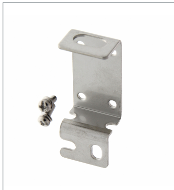
Horizontal Protective Cover Bracket E39-L142