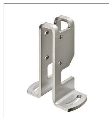
Photoelectric sensor accessories E39-L214