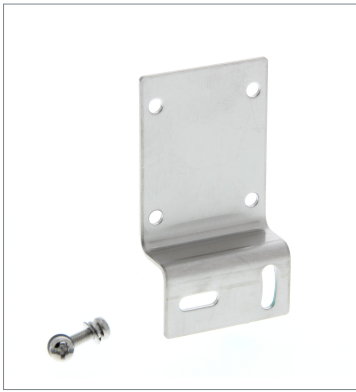
Horizontal Mounting Bracket