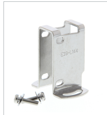
Compact Protective Cover Bracket E39-L144