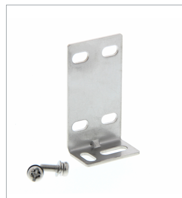
Mounting Bracket for Sensor E39-L153