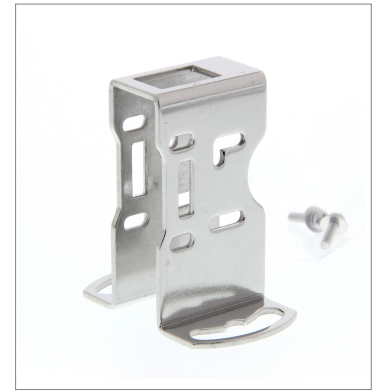
Metal Protective Cover Bracket