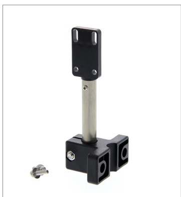
Sensor Adjuster E39-L150