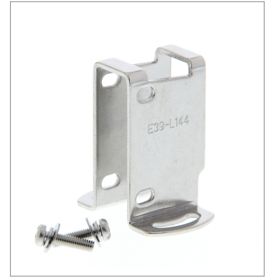
Compact Protective Cover Bracket E39-L144