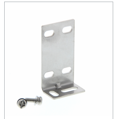
Mounting Bracket for Sensor E39-L153